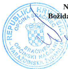
Načelnik Božidar Novoselec

u potpunosti zadovoljava uvjete iz Poziva na dostavu ponuda i zadovoljava kriterij ekonomski najpovoljnije ponuda te se usvaja ova Odluka o odabiru koja stupa na snagu s datumom donošenja.